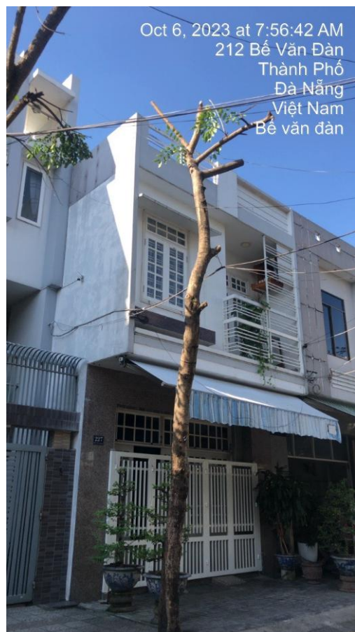
Cây xanh bị cắt trụi toàn bộ tán lá (vỉa hè số nhà 212 đường Bế Văn Đàn)