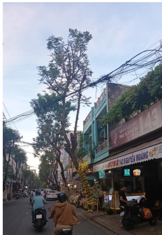
Cây xanh chỉ thực hiện cắt cành bên, nâng vòm lá quá cao nhưng không thực hiện hạ thấp tán, không chế độ cao (trên vỉa hè đường Nguyễn Hoàng)