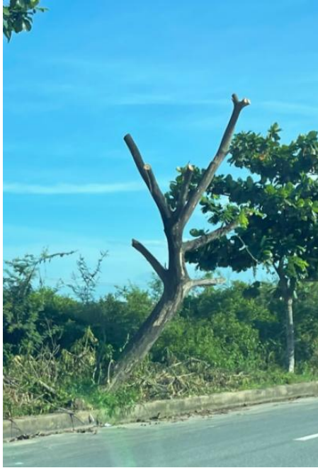
Cây xanh bị cắt trụ tán (trên vỉa hè đường Trần Nam Trung)