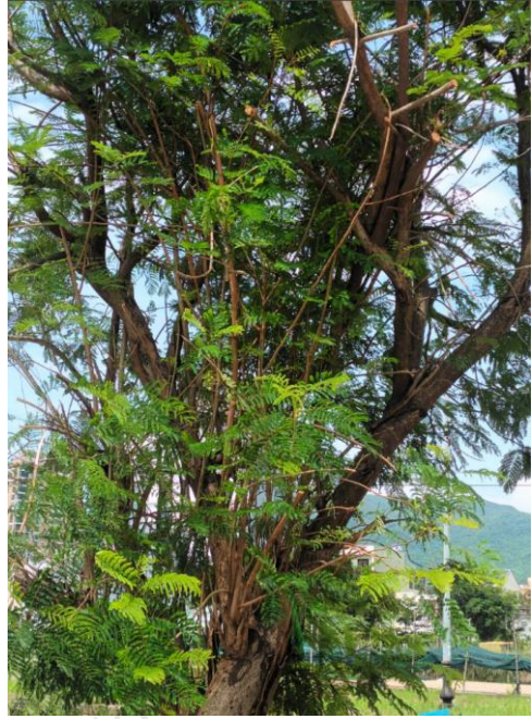
Cây xanh cắt tỉa gom tán nhưng không làm mỏng vòm lá (trên vỉa hè khu chung cư 4A Làng cá Nại Hiên Đông)