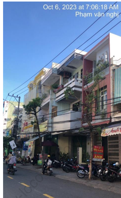
Cây xanh cắt tán quá mức (trên vỉa hè đường Phạm Văn Nghị)