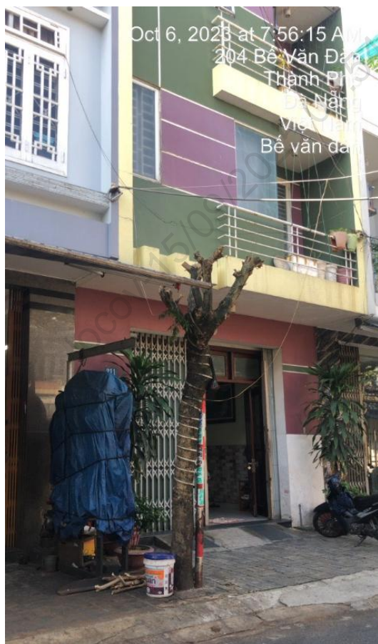
Cây xanh bị cắt trụi toàn bộ tán lá (vỉa hè số nhà 204 đường Bế Văn Đàn)