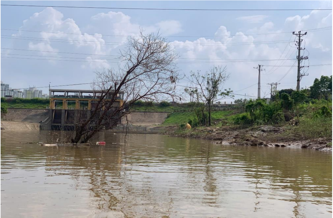
Cây cối, rác thải bồi lắng nhiều ở lòng kênh