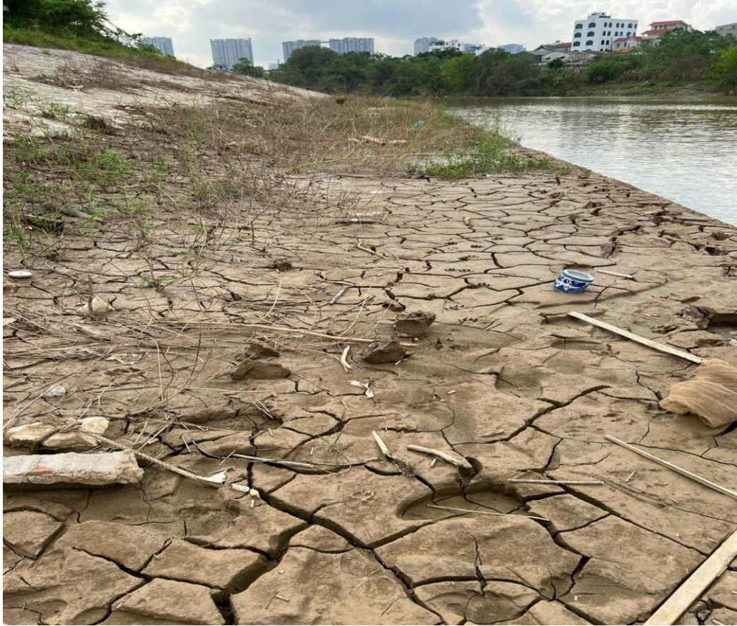
Bùn đất bồi lắng tại cơ kè, mái kè phía bờ tả

Với điều kiện khí tượng thủy văn hiện nay và nhu cầu dùng nước của hệ thống thủy nông Bắc Hưng Hải vào thời vụ đồ ải khẩn trương cùng với hiện trạng lòng kênh ngoài Xuân Quan bị bồi lắng ách tắc như trên, việc nạo vét là việc rất cấp thiết để đáp ứng được khả năng dẫn nước phục vụ sản xuất nông nghiệp và các mục tiêu dân sinh kinh tế. Mặt cắt ước của tuyến kênh ngoài thượng lưu cống Xuân Quan bị thu hẹp nghiêm trọng, trong điều kiện những năm gần đây mực nước thượng lưu cống Xuân Quan luôn xuống thấp vào thời điểm khẩn trương lấy nước phục vụ sản xuất nông nghiệp. Do vậy tuyến kênh ngoài Xuân Quan cần được đầu tư nạo vét đảm bảo dẫn nước tưới vụ chiêm xuân 2025-2026 là việc làm cần thiết và cấp bách.