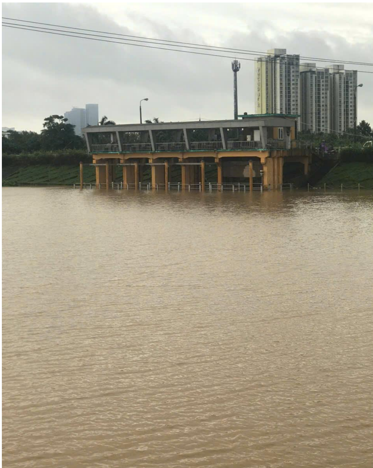
Mức nước kênh ngoài cống Xuân Quan tại thời điểm cơn bão Yagi