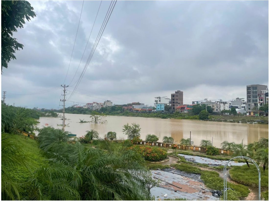
Mức nước kênh ngoài cống Xuân Quan tại thời điểm cơn bão Yagi