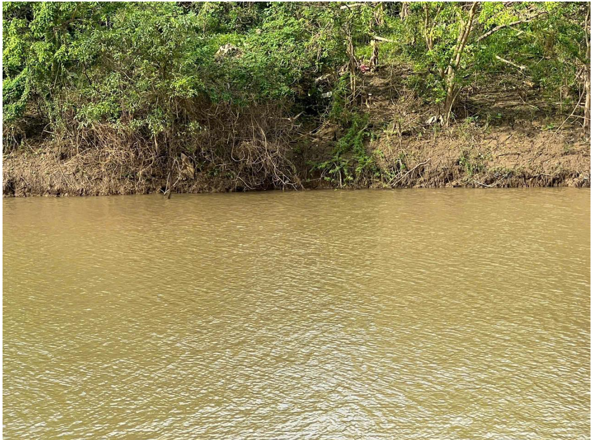
Phía bờ hữu khi mưa xuống vẫn xảy ra các hiện tượng sạt cục bộ.