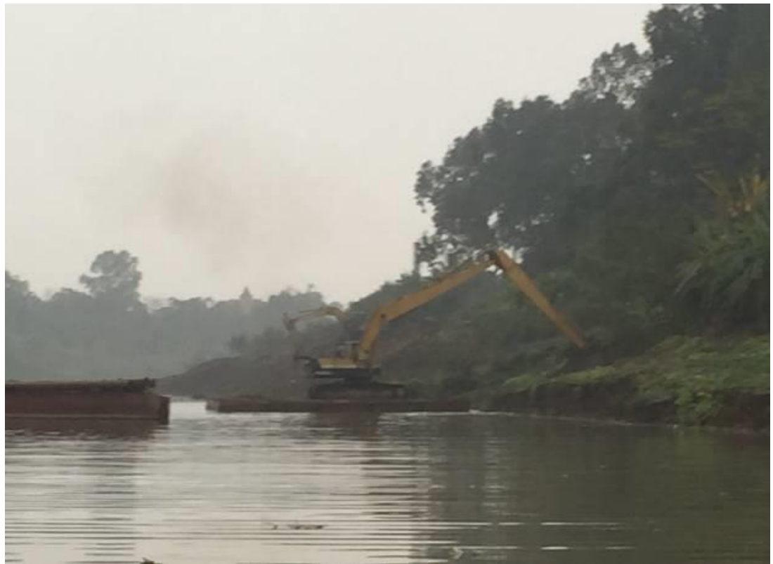
Mặt cắt kênh bị sạt trượt thu hẹp. Khối lượng trên mực nước thi công phải dùng máy xúc để đưa phần đất trên mái xuống sau đó dùng tàu hút bùn để nạo vét