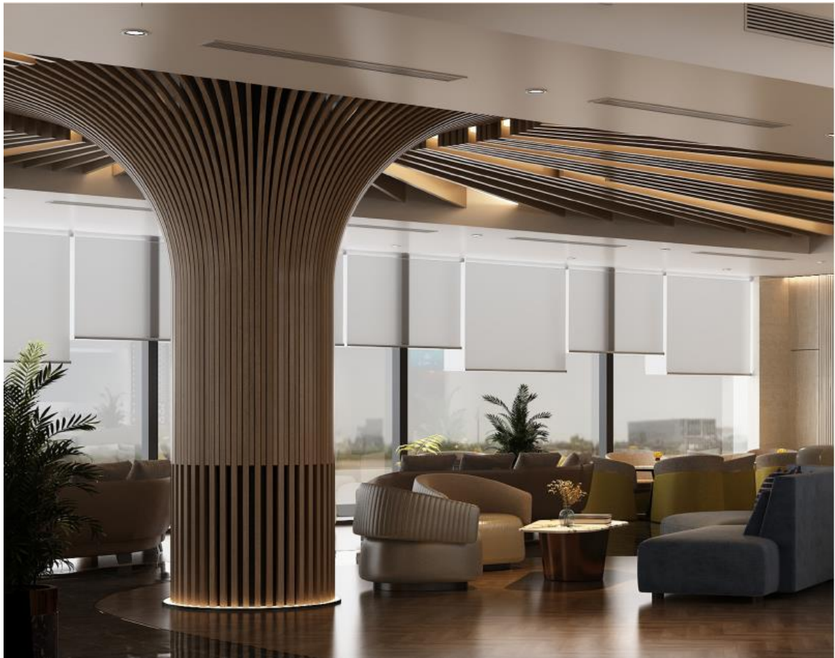
Minh họa Khu ghế ngồi nhóm

Một số ghế ngồi được bố trí gần vách kính tạo ra các không gian đặc biệt chỉ có ở phòng Lounge tại sân bay để khách hàng có thể thưởng thức quang cảnh sân bay từ trên cao..