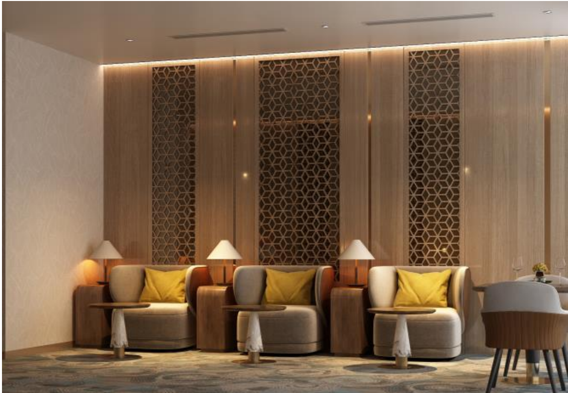
Minh họa Phòng Vip

Phòng Vip có không gian riêng biệt, được bố trí thiết bị và nội thất cao cấp (thảm trải sàn, sofa kết hợp bàn trà đơn .v.v)