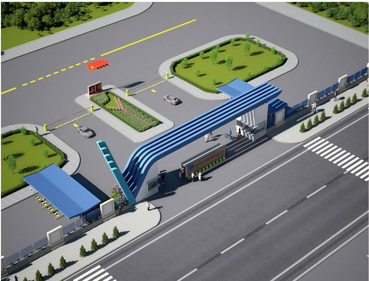
Hình 1: Phối cảnh tổng thể mái che khu vực camera an ninh ra vào cổng chính