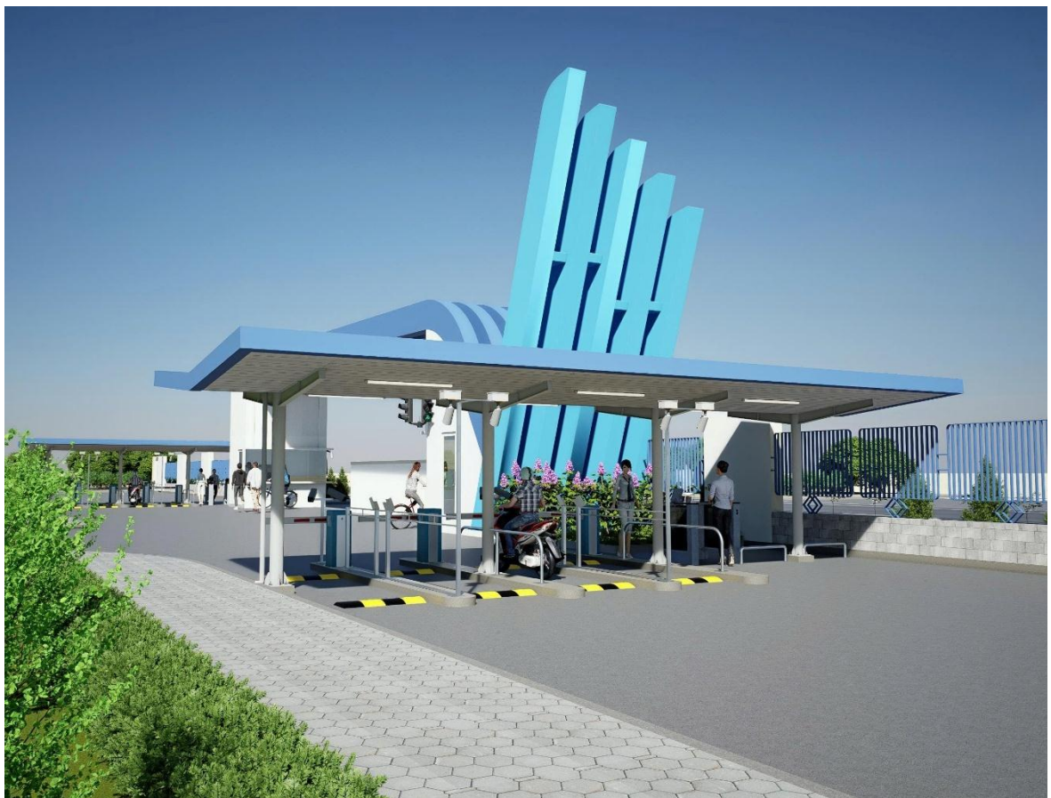
Hình 3: Phối cảnh mặt sau lối ra cổng khu vực camera an ninh