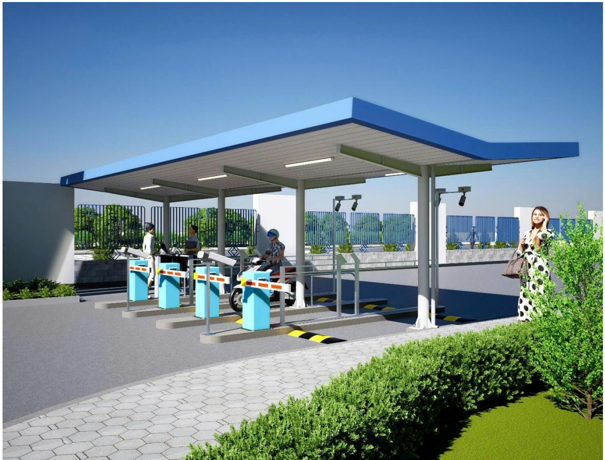
Hình 2: Phối cảnh mặt trước lối ra cổng khu vực camera an ninh