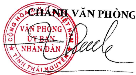
Trần Trọng Chung