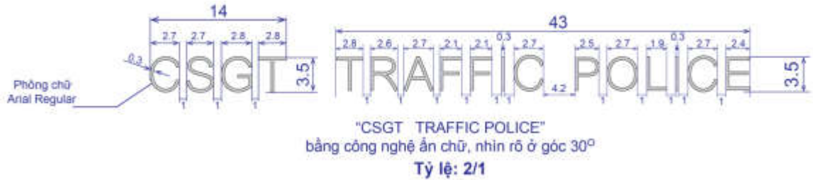
Hình 2: Quy cách cụm ký tự "CSGT" và "TRAFFIC POLICE"