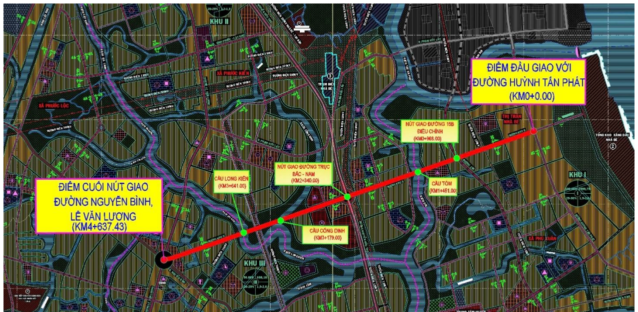
Bản đồ phạm vi Dự án