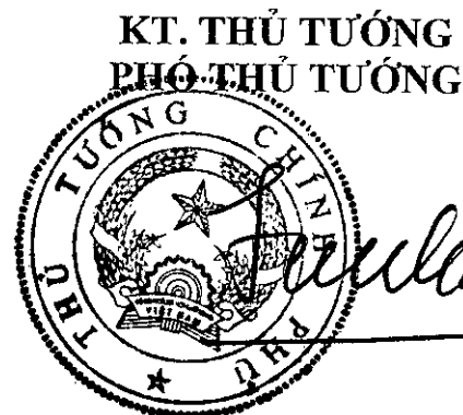
Lê Minh Khái